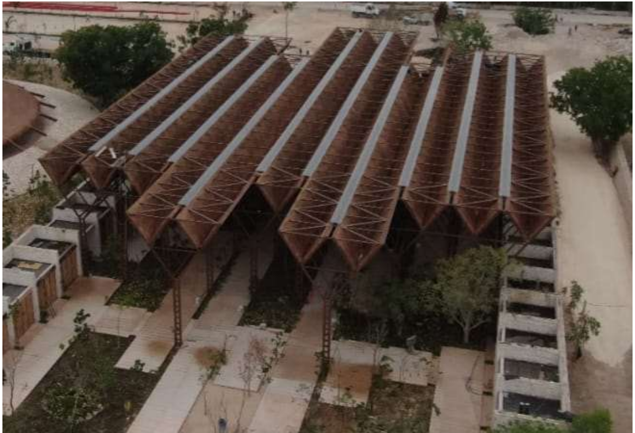
CENTRO DE ATENCION A VISITANTES