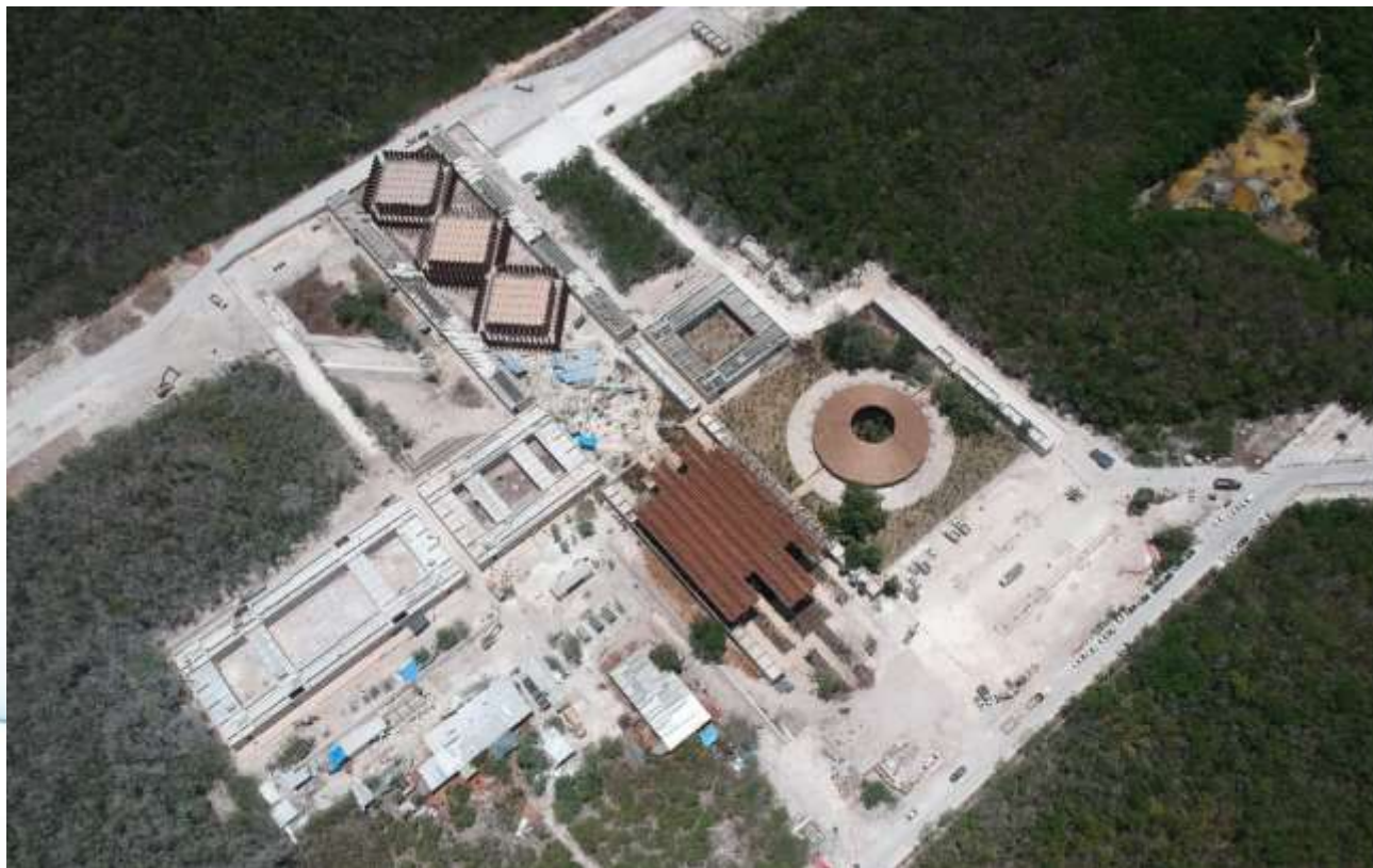
PLANTA DE CONJUNTO

CONSTRUCCION DE CENTRO DE SERVICIOS Y EQUIPAMIENTO EN PARQUE NACIONAL DEL JAGUAR, EN EL MUNICIPIO DE TULUM, ESTADO DE QUINTANA ROO