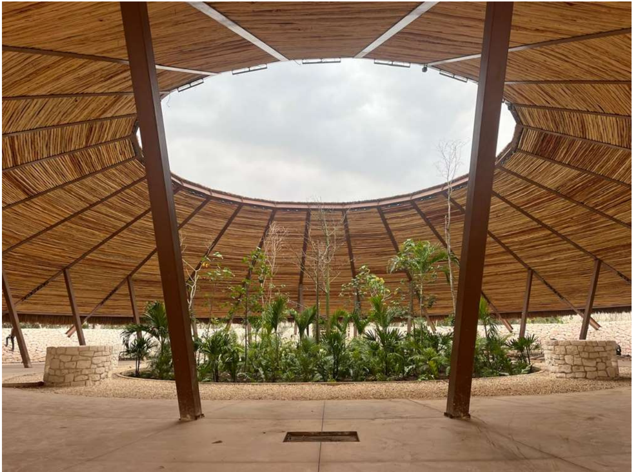
COCINA DE HUMO